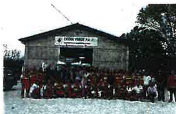
Disponibili posti alla Croce Verde